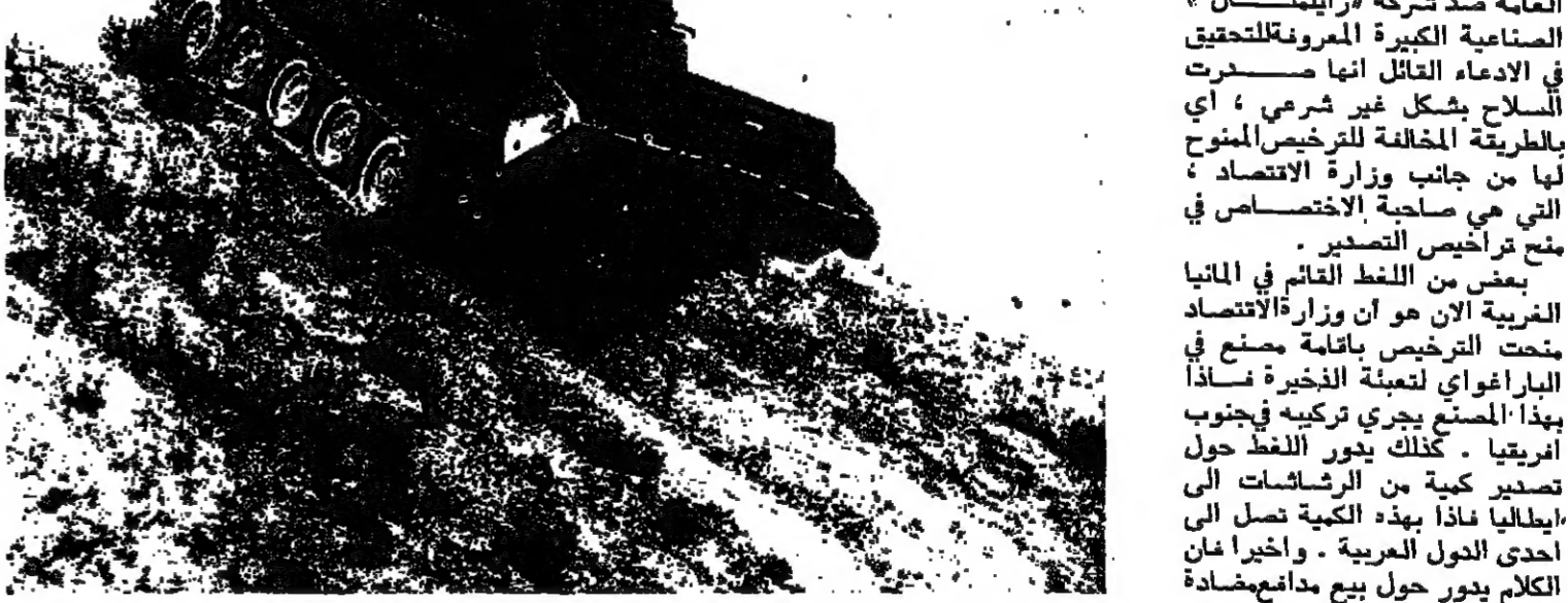
مجنونة ألمانية متطورة

الا نسبة ٤٠ من الواحد بالمشة من مجموع ارقام التصدير الصناعي الألماني الغربي . وما تجدر الإشارة إليه في هذا النطاق هو ان نسبة ٨٠ بالمائة من التصدير السلاحي الألماني الغربي هي من السفن .